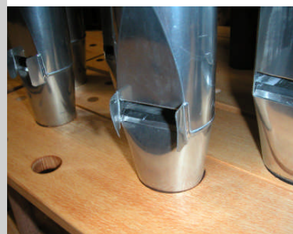
Die grau gedruckten Register sind im ersten Bauabschnitt 2004 noch nicht fertig gestellt.